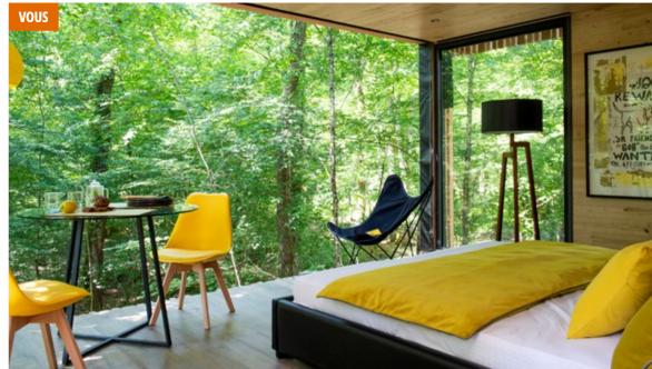
Loire Valley Lodges, à Esvres-sur-Indre : 18 cocons perchés en pleine forêt.