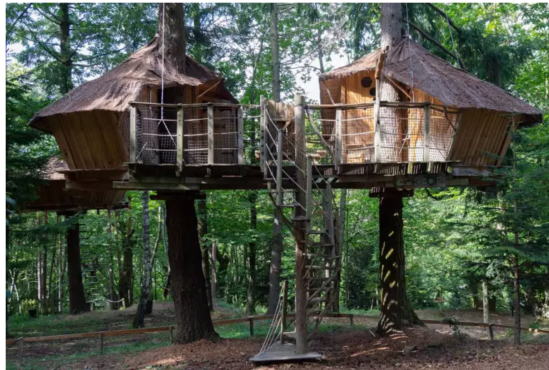
Que diriez-vous de passer la nuit dans une cabane?

Les 9 cabanes du domaine de Labrousse sont construites au cœur d'une forêt de pins Douglas et de châtaigniers. La plus basse est perchée à 4,5 mètres, et la plus haute à 10 mètres. Passez une nuit en pleine nature, bercés par le chant des oiseaux, et profitez de la terrasse pour contempler la cime des arbres et apercevoir des animaux au réveil. Le petit-déjeuner est livré au pied de la cabane, et il est possible de commander des paniers repas.