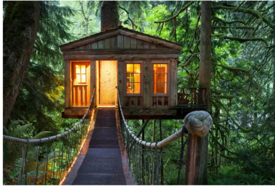
Que diriez-vous de passer la nuit dans une cabane?

Les beaux jours sont de retour et vous cherchez une idée d'escapade originale et dépaysante pour le week-end? Que diriez-vous de passer la nuit dans une cabane perchée dans les arbres? En mode sportif avec tyrolienne et pont de singe, ou ultra-luxe avec spa privatif, il y en a pour tous les goûts!