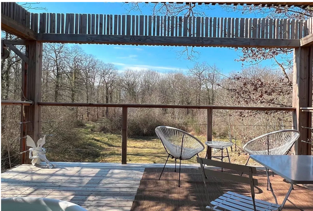
8/11 Séjour au Loire Valley Lodges en Touraine.