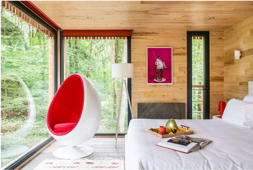
10/11 Séjour au Loire Valley Lodges en Touraine.