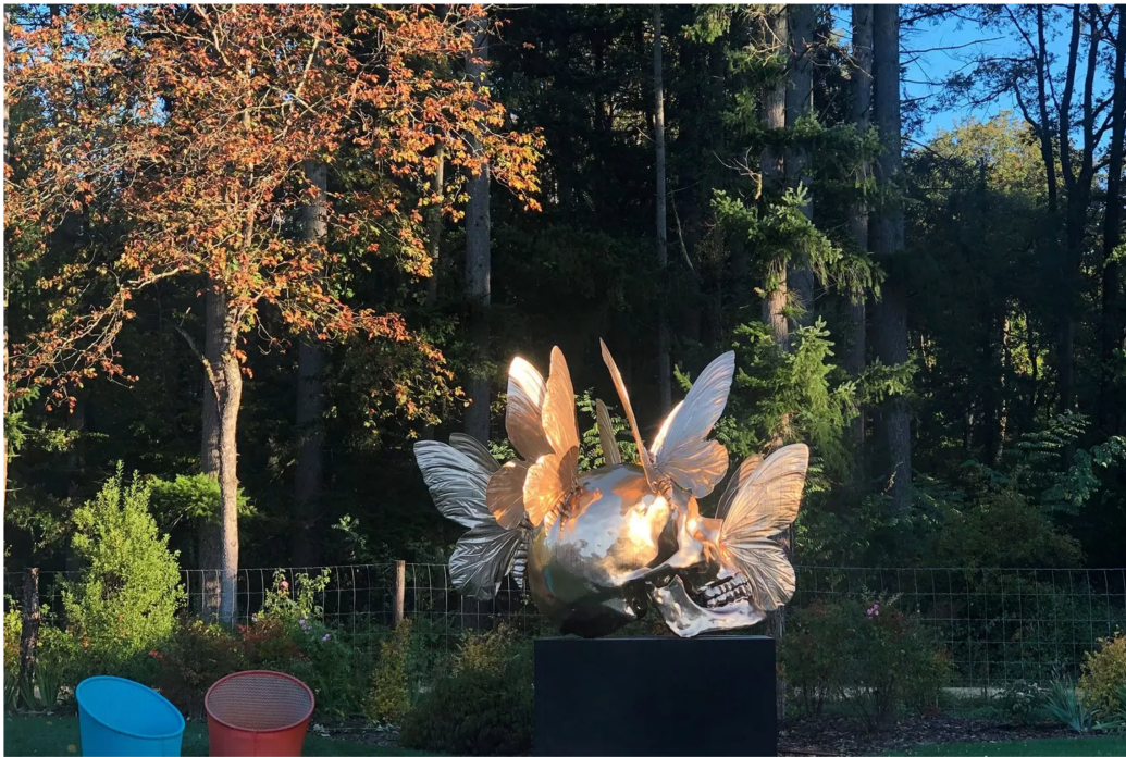
6/11 Séjour au Loire Valley Lodges en Touraine.