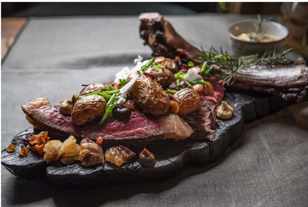
11/11 Séjour au Loire Valley Lodges en Touraine.