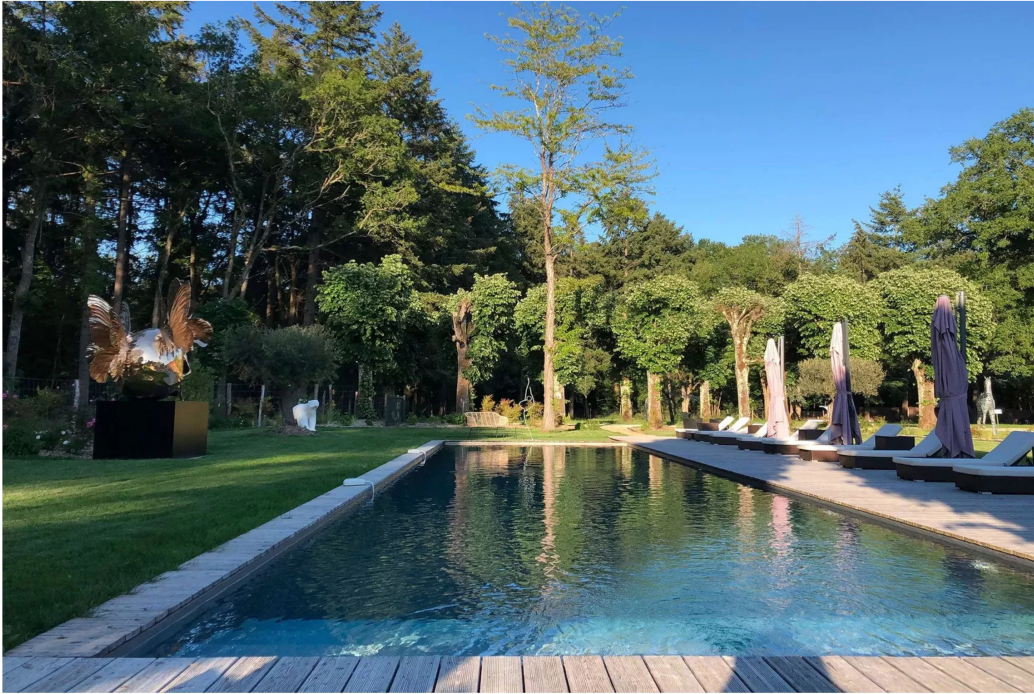
3/11 Séjour au Loire Valley Lodges en Touraine.