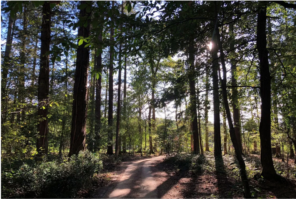
5/11 Séjour au Loire Valley Lodges en Touraine.