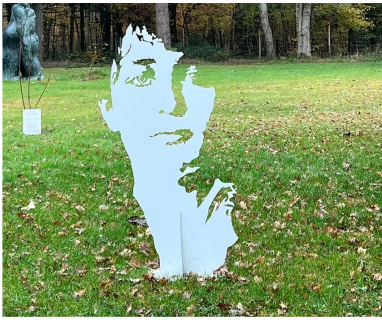
2/11 Séjour au Loire Valley Lodges en Touraine.