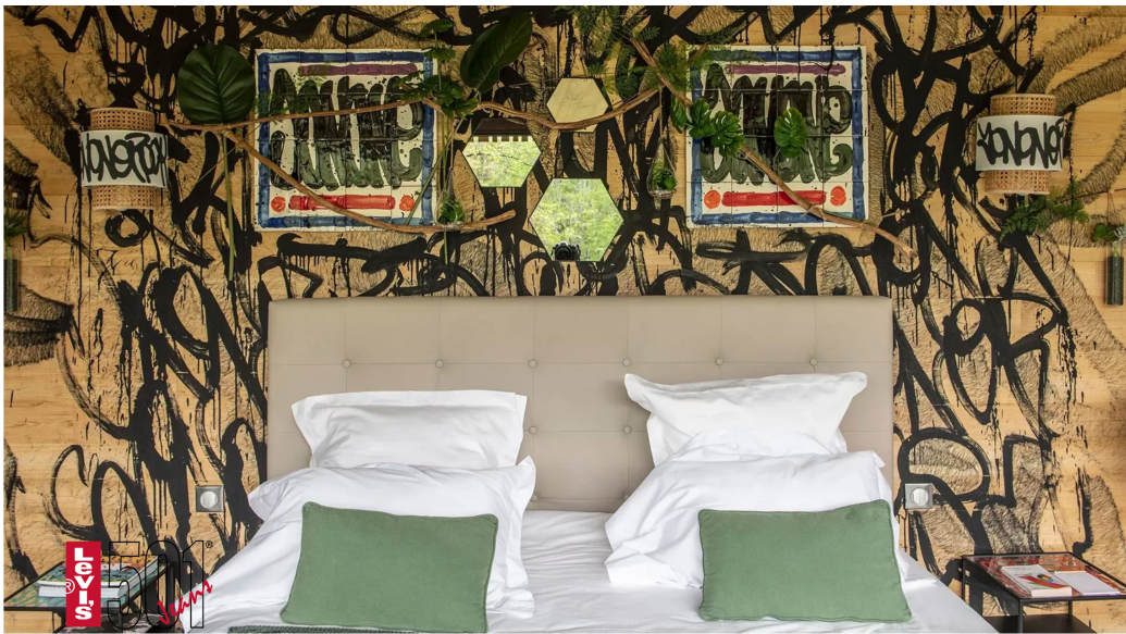
7/11 Séjour au Loire Valley Lodges en Touraine.