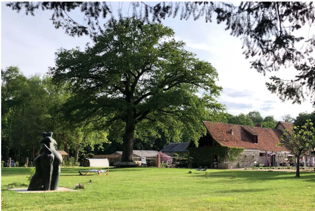
1/11 Séjour au Loire Valley Lodges en Touraine.