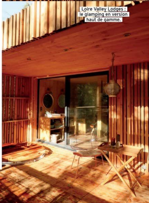
Loire Valley Lodges : le glamping en version haut de gamme.